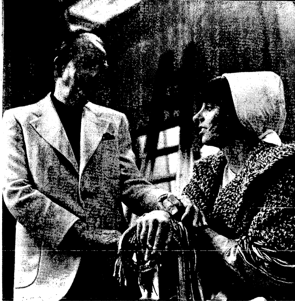
וינסנט מינלי ובתו ליזה בעת צילום סרטו האחרון "נינה"