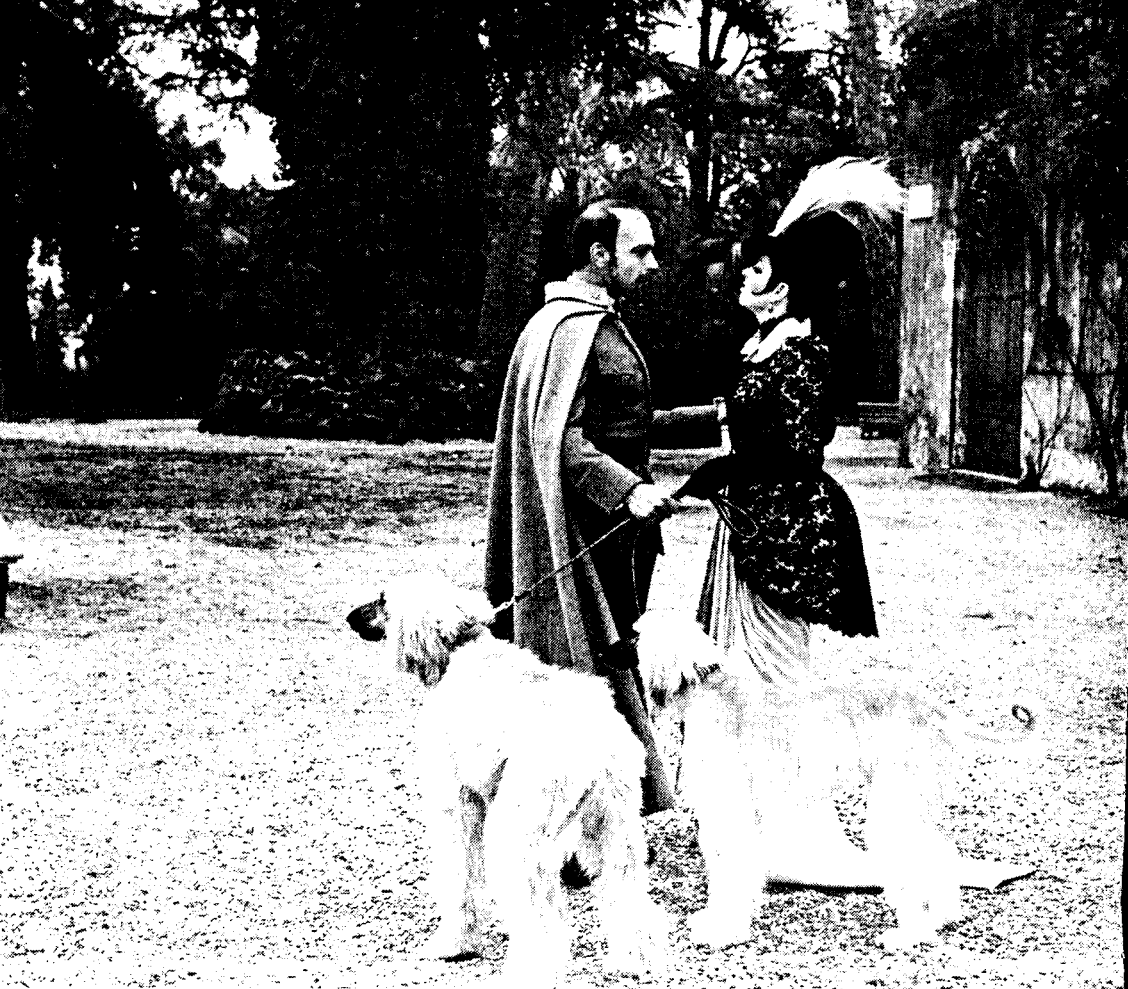
ליזה מינלי - "נינה" (1976)

ולעיצוב הלטים חלומיים, זאת בניגוד לסרטיהם הארציים של סטנלי דונן וג'ין קלי שנוצרו במקביל עבור מטרו.