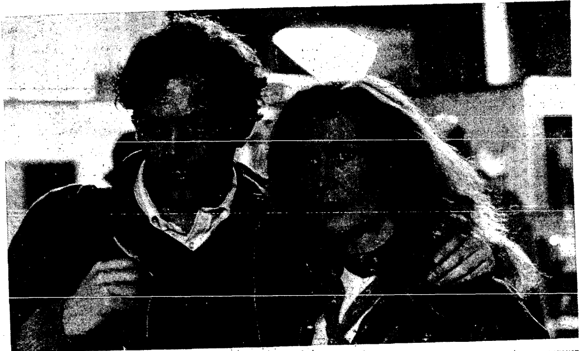
פאטריק דוור ובריגיט פוסיי ב"בן הסורר" של קלוד סוטה.

בימאי: אינגמאר ברגמן שחקנים: אינגריד ברגמן, ליב אולמן, ארלנד יווסטון. פגישה בת יממה בין אם ובתה שלא התראו משך שבע שנים - האם, פסנתרנית בעלת מוניטין העסוקה בהופעות וקונצרטים והבת נשואה לכומר וגרה עימו בכפר נורבגי קטן. ברגמן מחמיר את הסבל ומוסיף עוד אחות הלוקה בשיתוק חלקי ובאלם ומהווה חוליה נוספת בשרשרת הסיטוים הפוקדים את גבורי הסרט משך אותה יממה אומללה. (92 דקות).