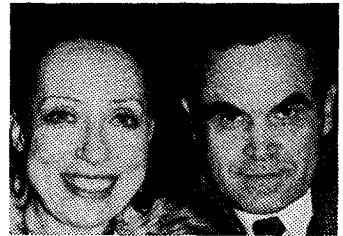
פאנפילוב – תמא, התסריט המלא