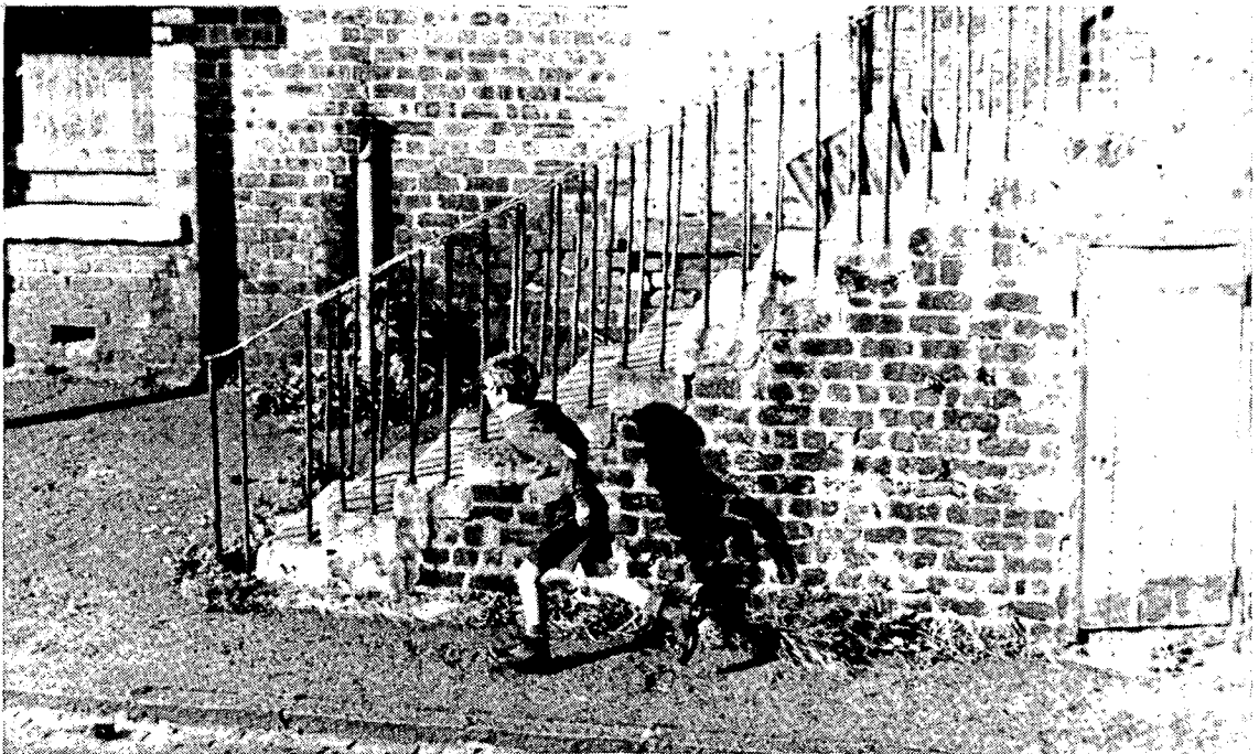
ביל דאגלס - ילדותי

סרט שנעשה ע"י 70 אמני הנפשה, 350 סצינות 300 אלף ציורים בגירסת אנימציה לאליגוריה של ג'ורג' אורוול. חיות בחווה מגרשות את המעביד שלהן אך מרציאות מקרבן רוחן חדש. (73 דקות).